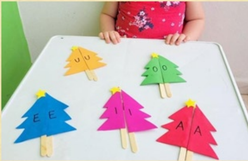
Pareamento de cores e vogais.